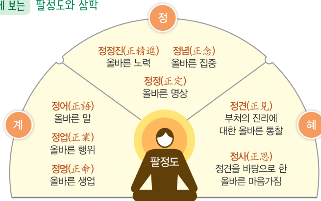
Q 한눈에 보는 팔정도와 삼학

앞에서도 시사되었듯이, 무명은 열반의 결과가 아니라 오히려 열반으로 가는 길을 막는 장애물입니다. 그 장애물을 없애는 데 필요한 노력이 바로 팔정도이고, 그중 특히 정견(正見, 바른 견해), 그리고 정견을 바탕으로 한 정사(正思, 바른 생각)는 무명을 벗어나는 일과 매우 직결됩니다. 무명이란 실상을 보지 못하는 어리석은 상태를 뜻하기 때문입니다. 이 직결은 팔정도와 삼학(三學)의 관계를 생각해 보면 더욱 분명해집니다.